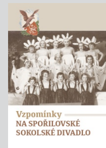
Vzpomínky NA SPORILOVSKÉ SOKOLSKÉ DIVADLO