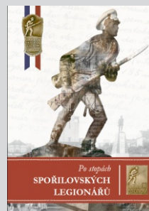
Po stopách SPORILOVSKÝCH LEGIONÁŘŮ

Cena obou publikací je 250 Kč. Při zakoupení obou knih současně poskytuje redakce Spořilovských novin až do odvolání mimořádnou slevu a obě knihy lze zakoupit za 300 Kč (platí pouze pro osobní odběr v Praze-Modřanech, při zaslání poštou je připočítáváno poštovné a balné 100 Kč). Bližší informace rádi poskytneme na elektronické adrese noviny@sporilov.info nebo na tel. 777 944 684.